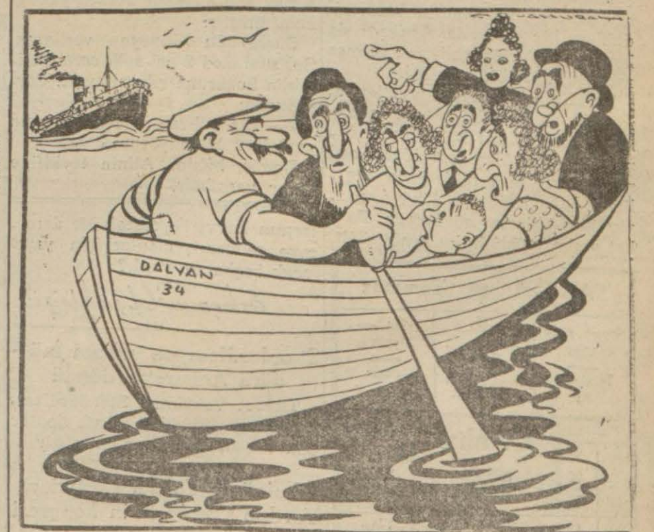
... — Bu ne biçim kaptan, üstümüze geliyor! Sandalcı — Şaşma bazirgân, sandalın halini görünce Büyükdada iskelesi sanmıştır.

Son zamanlarda, millî müdafaa de ikramiyeli ve % 6 faizli olmak üzere Ağustosta ihracına dair baz rın kısmen % 7,5 faizli ve kısmen (Devamı 5 inci sayfada)