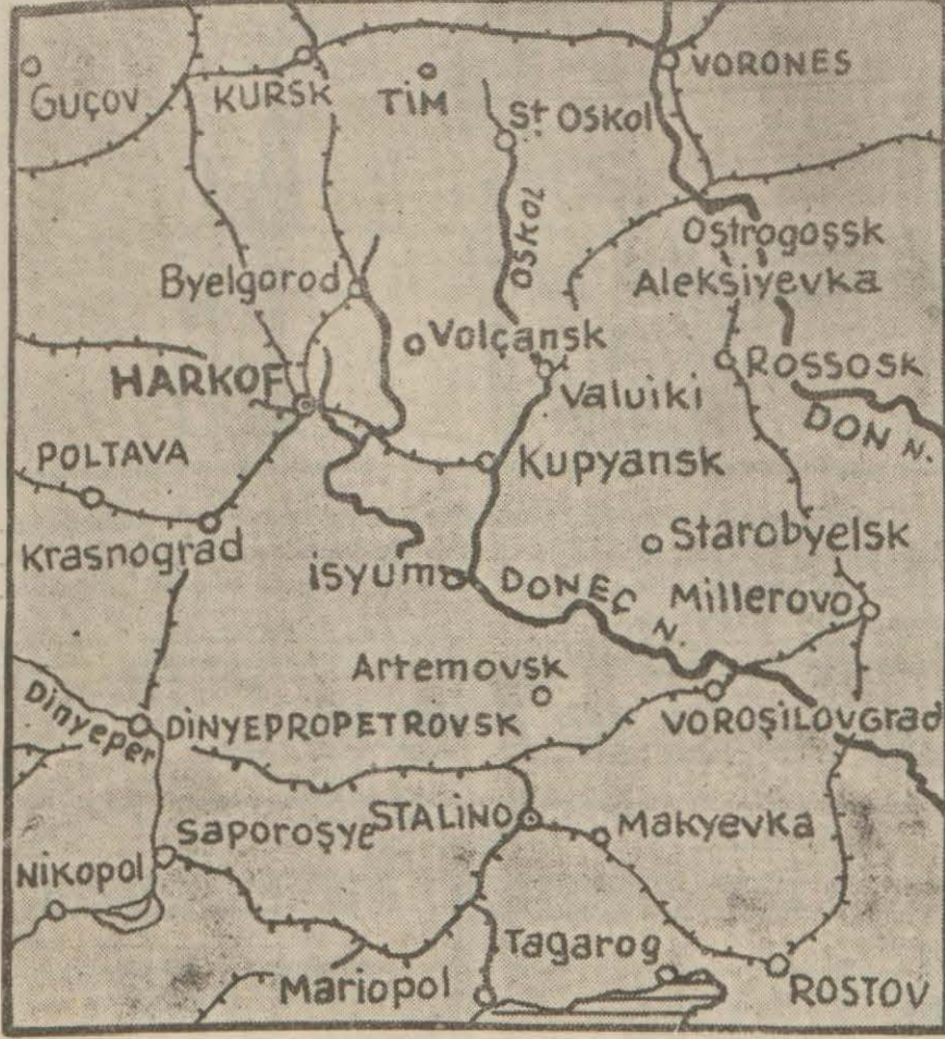
Şark cephesinde harekâta sahne olan saha

(Her iki yazıyı bugün 3 üncü sayfamızda bulacaksınız)