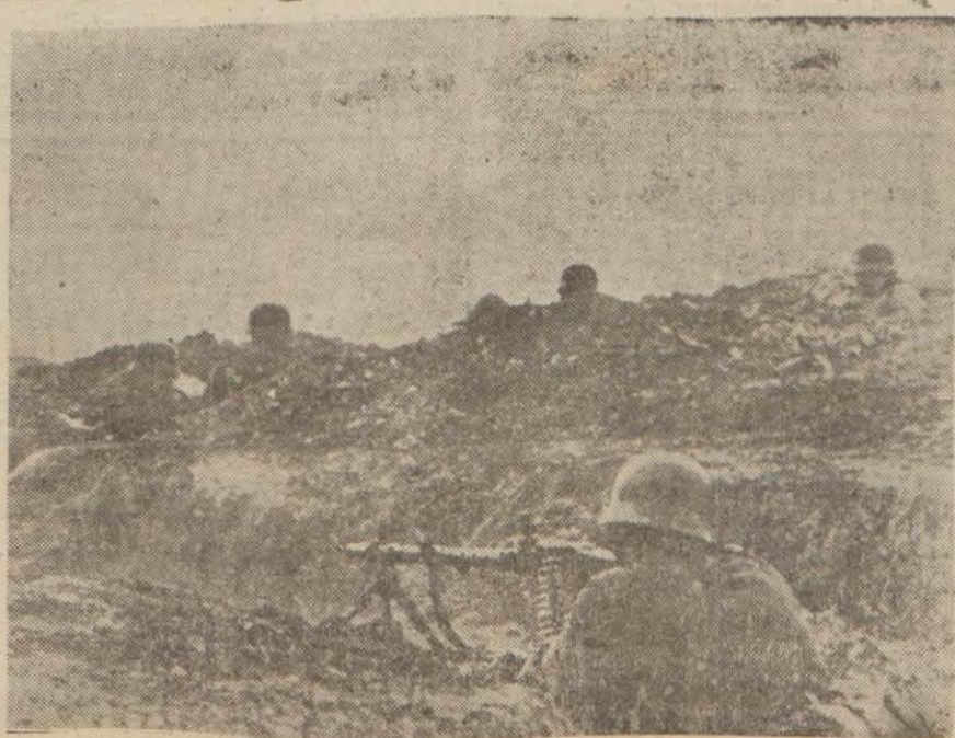
Leningrad cephesinde siperler içinde Alman askerleri

1 — Mısır cephesinde: El Alemeyn mintakasındaki muharebeler, 4 Temmuz günü akşama doğru kısa bir fasıla kaydedildikten sonra 5 Temmuz sabahından itibaren yeniden başlamış ve El Alemeyn'in 12 kilometre cenubunda bulunup bir Mihver tümeninin işgali altında olan ehemmiyetli bir tepe ve sirt, bu Mihver tümenini oradan geri atmak suretile İngilizler tarafından işgal olunmuştur. Mihver kuvvetlerinin bu tepe ve sirtin geri almak için yaptıkları teşebbüsler de neticesiz kalmıştır. Fakat, buna ve İngilizlerin insan ve mal zemece önemli takviyeler almakta olduklarının tahakkuk eylesesine rağmen El Alemeyn mintakasındaki umumî durum gene esaslı surette değişmemiş; yani teşebbüs henüz mareşal Rommel'in elinden general Ohinlek'in eline itikâl eylememiştir. (Devamı 5 inci sayfada)